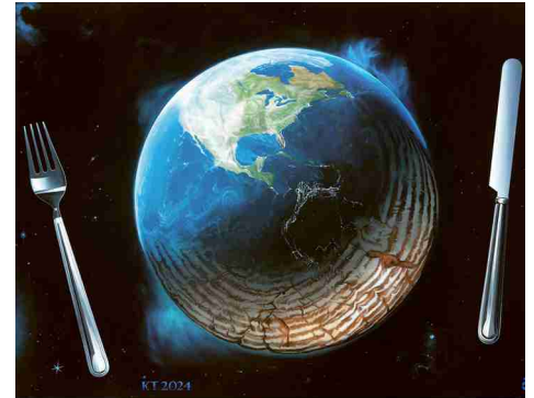
Hungertuch der Fastenaktion

Die Organisatoren schreiben zur diesjährigen Aktion: «Unsere Vision ist eine Welt ohne Hunger in der das Recht auf eine gesunde Ernährung gesichert ist. Doch die Hungerkrisen im globalen Süden nehmen zu und der Zugang zu genügend gesunder und kulturell angepasster Nahrung wird für die lokalen Gemeinschaften immer schwieriger. Hunger und Unterernährung