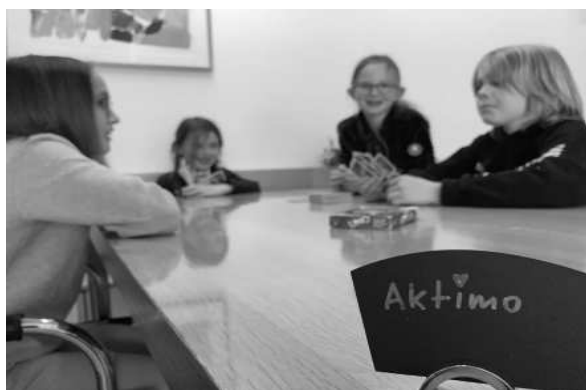
AM MITTAGSTISCH IM MATTLI