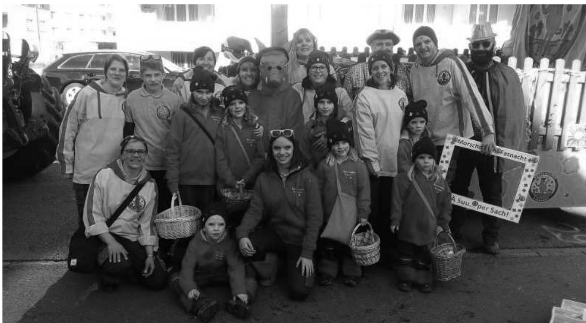
VEREIN MORSCHACHER FASNACHT MIT DEM SUULI

„D' Suulifasnacht“, wie viele Kinder unsere Fasnacht liebevoll nennen, gehört zum Morschacher Dorfleben – sie ist ein Teil der grossen Schaffenskraft von vielen Morschacher Vereinen und tatkräftigen Helferinnen und Helfern.