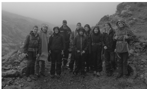
2019 2-TÄGIGE WANDERUNG GLATTALP

Seit Beginn an ist das Kids Turnen der Schule angeschlossen, dies wird sich nun ändern, denn aus dem Kids Turnen wird nun der Turnverein Morschach.