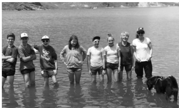
2018 WANDERUNG IM LIDERNEN GEBIET, ABKÜHLUNG IM SPILAUERSEE

Ab der 5. Klasse bieten wir jedes Jahr zusätzlich die Möglichkeit, bei den Wandervögeln teilzunehmen, diese bereiten sich mit einigen kleineren Wanderungen in der Region auf eine grössere Wanderung vor. Es wurden auch schon 2-tägige Wanderungen mit Übernachtung gemacht.