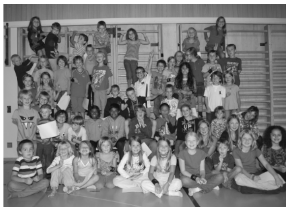
ERSTES KIDS JAHR 2011/ 2012

Wir hatten im ersten Jahr rund 30 Kinder, die dieses Angebot nutzten. Heute sind es rund 70 Kinder und Jugendliche, die wöchentlich in der Turnhalle stehen und sich sportlich betätigen. Doch nicht nur die Anzahl der Teilnehmer hat sich stark verändert, sondern auch bei den Leitern und Hilfsleitern, welche das Turnen erst ermöglichen, hat sich einiges getan. Aus zwei J & S Leiterinnen wurden 6 Leiterinnen und 11 Hilfsleiter und Hilfsleiterinnen, womit sich auch in Sachen Planung und Administration einiges getan hat.