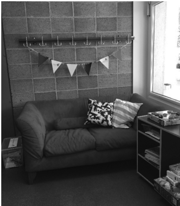
TREFFPUNKT FÜR DEN MITTAGSTISCH IST DAS SOFA IM SCHULHAUS MORSCHACH

Am 19. August 2019 trafen sich die ersten 3 Kinder im Foyer des Schulhauses bei unserem gemütlichen Treffpunkt, welcher dank Sofa, Spielen und Spielsachen zum Verweilen einlädt.