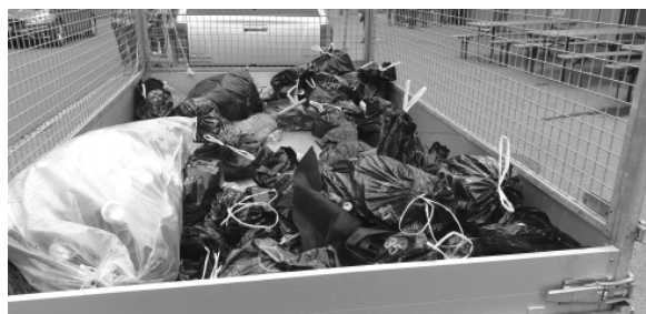
DER GESAMMELTE ABFALL WIRD ANSCHLIESSEND FACHGEGRECHT ENTSORGT.

lich waren dies Petflaschen, Aludosen und Zigarettenstummel, aber auch ein Rost von einem Wassereinlaufschaft wurde gefunden.