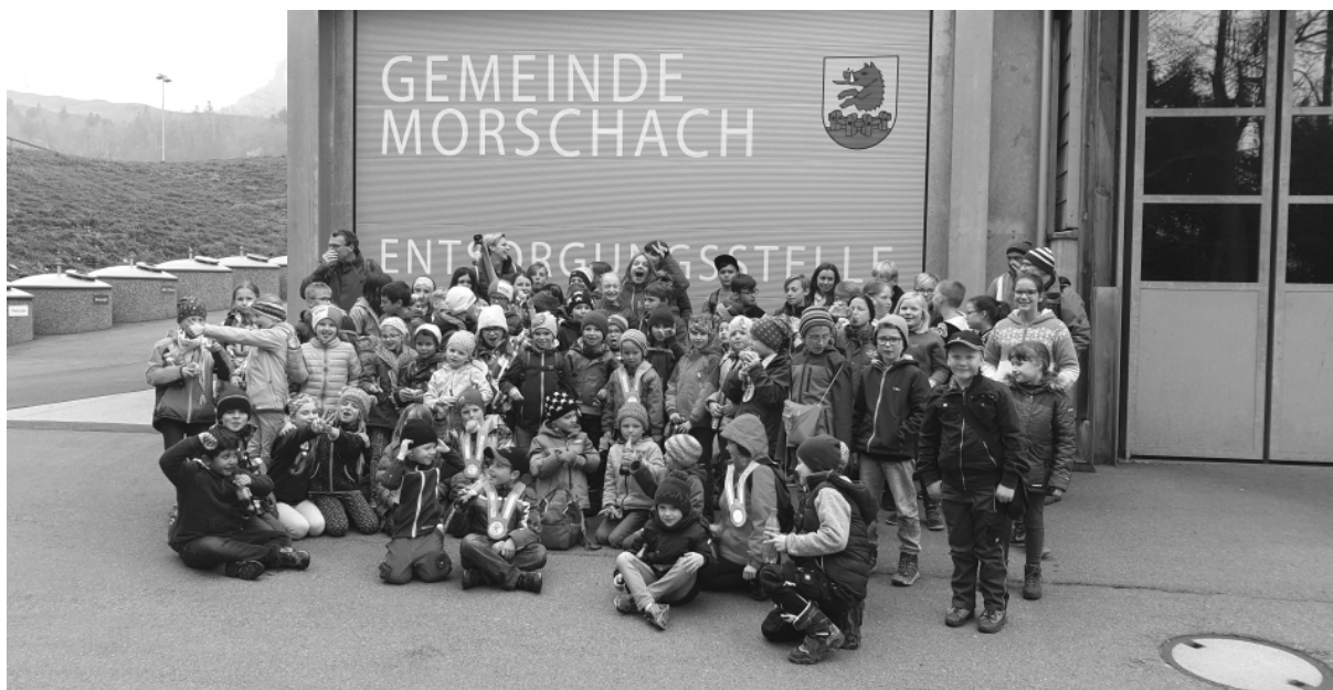
DIE SCHÜLERINNEN UND SCHÜLER FREUEN SICH NACH DER ARBEIT AUF EINEN KLEINEN IMBISS.