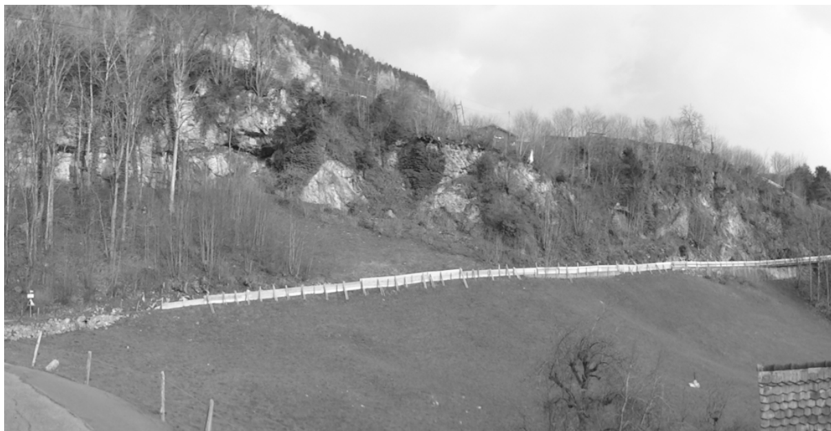
SCHILTIFLUEH WÄHREND DEN FELSREINIGUNGS- UND HOLZERARBEITEN

In letzter Zeit sind vermehrt Stein- und Geröllabgänge aus der Schiltiflueh in der Gemeinde Morschach auf die darunterliegende Strasse festgestellt worden. Letzte bekannte Ereignisse sind die Abbrüche vom 16. Februar 2019 (ca. 0.05 - 0.1 m 3 ), 24. Dezember 2018 (vereinzelte Steine) und 25. August 2018 (ca. 0.5 m 3 ).