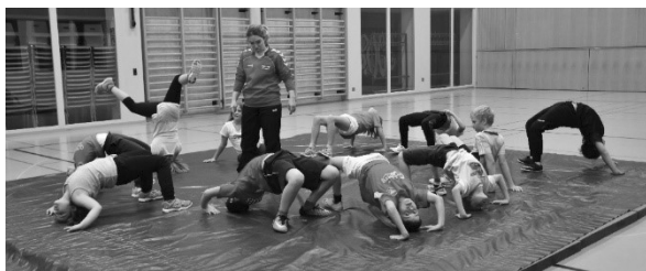
AUFWÄRMEN BEIM RINGEN

In den vergangenen acht Jahren haben wir, nebst dem allgemeinen Programm, auch einige spezifische Sportarten kennen gelernt, wie Orientierungslauf, Velofahren, Schwingen, Tanzen, Badminton, Selbstverteidigung, Unihockey, Basketball, Ringen, Langlauf, und Volleyball. Für diese spezifische Sportarten haben wir Fachleute beigezogen die uns dabei unterstützt haben.