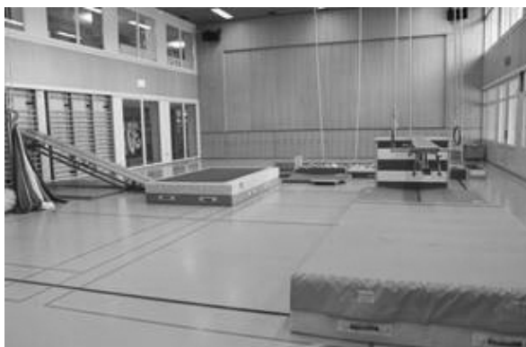
GERÄTEPARCOUR IN DER HALLE

Die Mütter, Väter und andere Begleitpersonen unterstützen die Kinder bei ihren ersten Erfahrungen in einer Gruppe. Sie lernen erste Regeln im Sozialgefüge kennen und können langsam und im geschützten Rahmen ihre körperlichen und sozialen Kompetenzen entdecken.