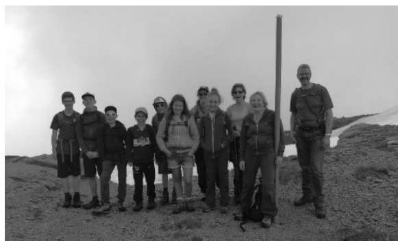
SPILAUER GRÄTLI 2018

Weitere erlebnisreiche Wanderungen machten wir auf den Uri Rotstock, Ortstock, Wildspitz-Gnipen und ins Lidernen Gebiet.