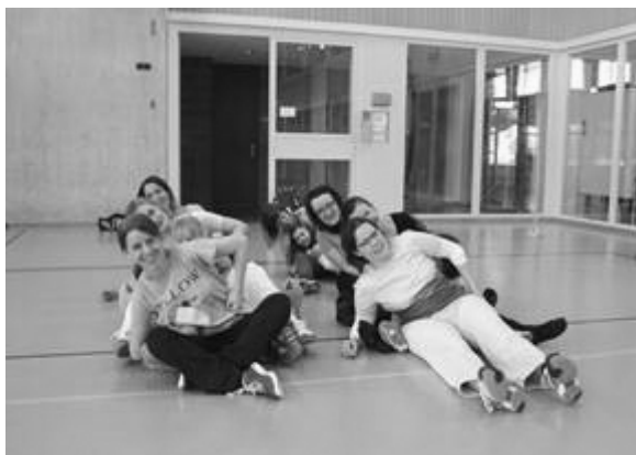
SPIELE IN DER GRUPPE

Wir haben abwechselnd die Turnlektionen vorbereitet, oft mit einem saisonalen Oberthema wie Fasnacht, Ostern, Zwerge oder Halloween. Ab und zu waren wir auch draussen, haben die Kühle des Waldes im Sommer, den Wind im Herbst und das Schlitteln und »Böbble« im Winter genossen. Für besondere Anlässe wie Laternenumzug und Fasnacht durften wir auch den Werkraum unentgeltlich benutzen.