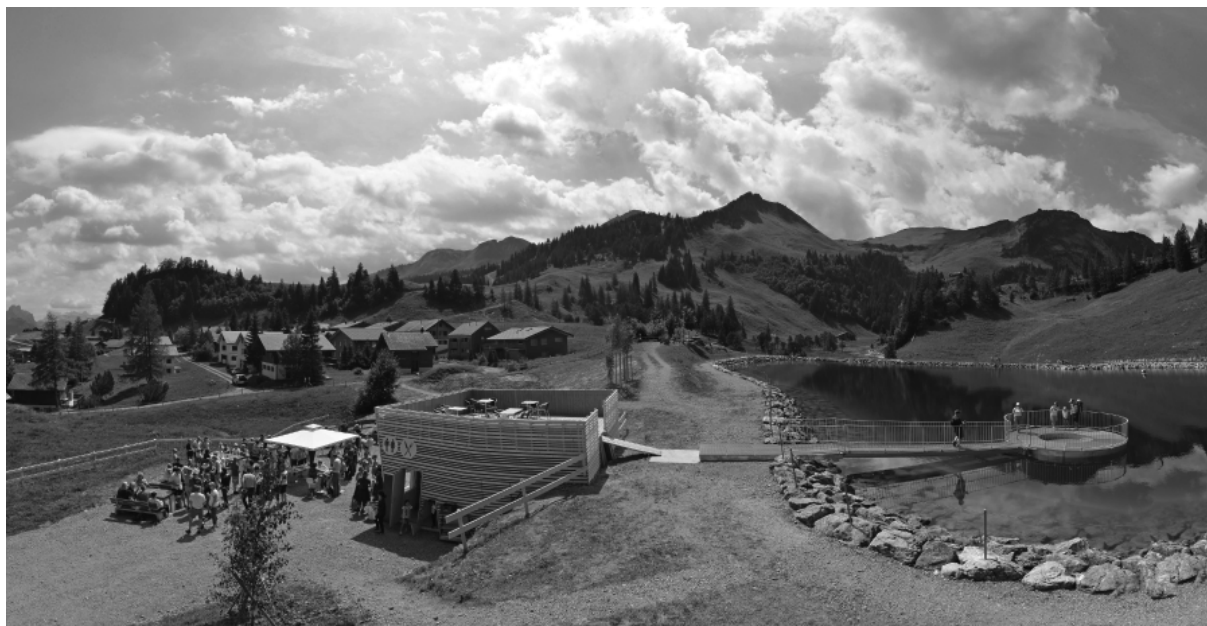
DER IMBISSSTAND UND EIN FUSSGÄNGER-STEG SIND DIE HAUPTBESTANDTEILE DES PROJEKTS „AUFWERTUNG STOOS-SEELI“

Am Samstag, 14. Juli 2018 wurde die erste und grösste Etappe des Projekts „Aufwertung Stoos-Seeli“ eröffnet. Gut 120 direkt oder indirekt im Projekt involvierte Gäste versammelten sich, um einen Fussgänger-Steg aufs Stoos-Seeli und einen Imbissstand zu eröffnen. Die Stoos-Muotatal Tourismus GmbH wird das Projekt 2019 mit weiteren Begrünungsarbeiten abschliessen.