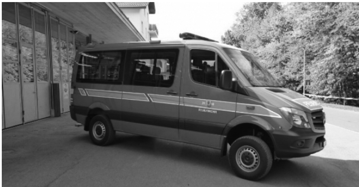
DAS NEUE ATEMSCHUTZ- UND MANNSCHAFTSFAHRZEUG DER FEUERWEHR MORSCHACH

Am Samstag, 13. Oktober 2018 ab 10.00 Uhr wird das neue Atemschutzfahrzeug der Feuerwehr Morschach feierlich eingeweiht. Die Bevölkerung und alle interessierten Personen sind zur Einweihung herzlich eingeladen.