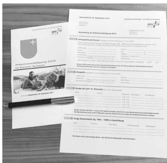
GESUCHSFORMULAR UND MERKBLÄTTER

Gesuchsformulare und Merkblätter können bei der Gemeindeverwaltung Morschach oder über die Homepage der Ausgleichskasse Schwyz ( www.aksz.ch ) bezogen werden. Das vollständig ausgefüllte Gesuch muss bis spätestens am 30. September 2018 bei der Ausgleichskasse Schwyz, Postfach 53, 6431 Schwyz eingereicht werden.