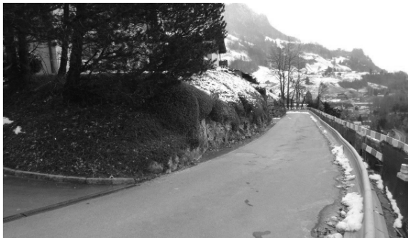
STANDORT DER NEUEN AUSWEICHSTELLE

Die neue Ausweichstelle wird im oberen Abschnitt der Axensteinstrasse im Bereich der Liegenschaft Axensteinstrasse 24 erstellt. Die Arbeiten für den Neubau der Ausweichstelle beinhalten Felsabbau, Böschungssicherungen und Arbeiten an Randabschlüssen und Belag.