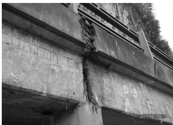
SCHÄDEN IM BEREICH LEHNENVIADUKT

Entlang der Felspartie zwischen Wil und Unter Wilgis verläuft die Strasse teilweise auf einem Lehnenviadukt, welcher Schädstellen aufweist. Der Lehnenviadukt wurde untersucht und muss entsprechend saniert werden.