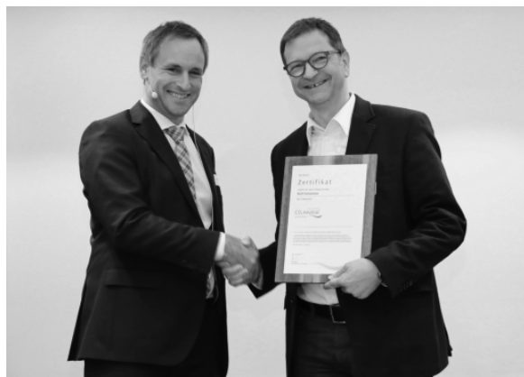
LABELÜBERGABE AN DAS MATTLI ANTONIUSHAUS

Das grosse Engagement des Mattli Antoniushauses zeigt sich in den vielen zielgerichteten Massnahmen, die bereits umgesetzt worden und weiter geplant sind. Die Gäste zahlen jeweils pro Nacht 2 CHF Nachhaltigkeits-Bonus. Mit dem dadurch erzielten Betrag werden die Nachhaltigkeitsmassnahmen finanziert. Ab diesem Jahr wird nun der jährliche Co 2 -Ausstoss erhoben, um den Erfolg der Massnahmen besser zu messen und auszuweisen. Umgesetzte und geplante Massnahmen umfassen unter anderem: Warmwasseraufbereitung mit Solarthermie auf dem eigenen Dach sowie Fernwärme aus Biomasse, Bezug von Ökostrom aus 100% Urner Wasserkraft, Beschaffung von Waren und Gütern, welche in der Schweiz hergestellt werden und Einführung von klimaneutralen Drucksachen.