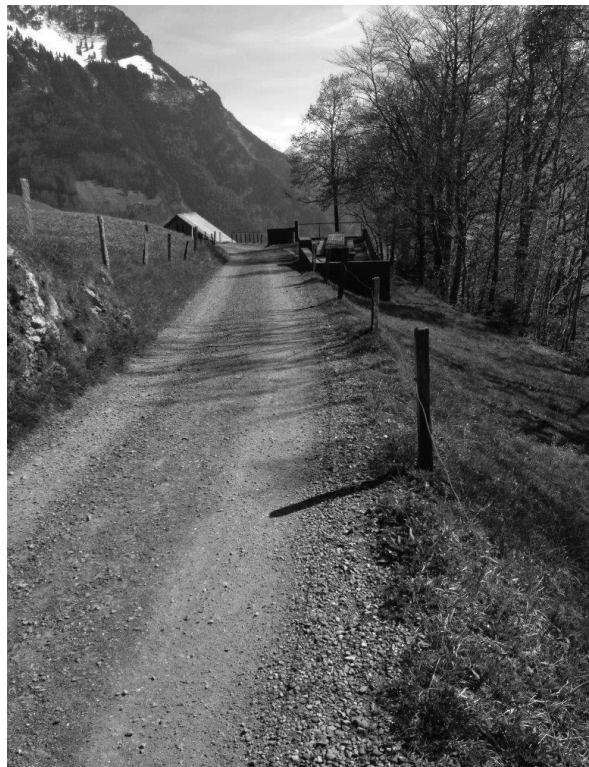
IM HINTEREN TEIL IST DIE STRASSE ALS KIESWEG AUSGEBAUT.

Der Belagsweg zeigt typische Zeichen der Alterung wie Absanden, Kornausbrüche und Belagsrisse. Abschnittsweise sind Verdrückungen und Spurrinnen erkennbar. Am Rand sind immer wieder Belagsschäden und Abdrückungen erkennbar, die auf das weitgehend fehlendes Bankett zurück zu führen sind. In den vergangenen Jahrzehnten sind an verschiedenen Stellen und Abschnitten Böschungssicherungen ausgeführt worden.