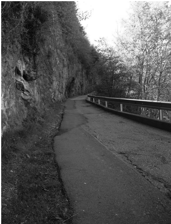
AN MEHREREN STELLEN WEIST DIE SCHILTISTRASSE BELAGSRISSE AUF.

Die erste Erstellung des Weges ist nicht bekannt, dürfte aber weit zurückgehen. Er wurde ursprünglich mit einem Steinbett gebaut und vor rund 40 Jahren teilweise mit einem Belag versehen. Der Güterweg „St. Franziskus-Tannen“ ist auf den ersten rund 1'100m, bis zum Reservoir „Schilti“, mit einem Belag versehen. Der Weg hat bis zu diesem Punkt teilweise eine Breite von knapp 2.80m. Auf einem sehr kurzen Abschnitt ist er entlang einer Felswand nur rund 2.6 m breit. Der hintere Teil bis in die „Tannen“ ist als Kiesweg ausgebaut, rund 3m breit und ca. 700 m lang. Die Strasse ist Teil des „Weg der Schweiz“ und wird deshalb regelmässig begangen.