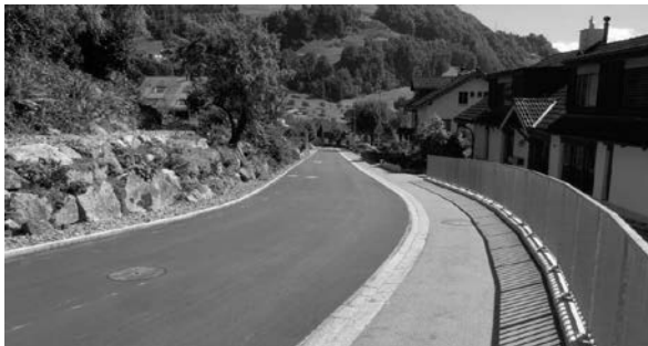
AXENSTEINSTRASSE IM BEREICH EINFAHRT HUSMATT II BLICK RICHTUNG DORF