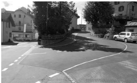
EINFAHRT AXENSTEINSTRASSE (POSTRANK)

Im Projektperimeter haben diverse Werke ihre Leitungsnetze kontrolliert und teilweise ersetzt. Unter anderem die Wasserversorgungsgenossenschaft Schwyzerhöhe-Morschach, die AGRO Energie Schwyz AG, das Elektrizitätswerk Altdorf sowie die Swisscom haben Leitungen und Schächte ersetzt oder neu erstellt.