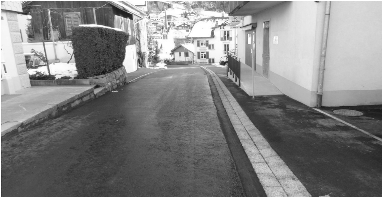
DIE AXENSTEINSTRASSE IM BEREICH SCHULHAUS

Die vorgesehenen Etappen der Axensteinstrasse konnten zeitgerecht abgeschlossen werden. Seit wenigen Tagen sind die Sanierungsabschnitte bereits wieder ohne Einschränkungen befahrbar. Die letzte Etappe startet im Frühjahr 2016 und dauert bis anfangs Sommer. Die Deckbelags- und Abschlussarbeiten werden im Frühjahr / Sommer 2017 ausgeführt.