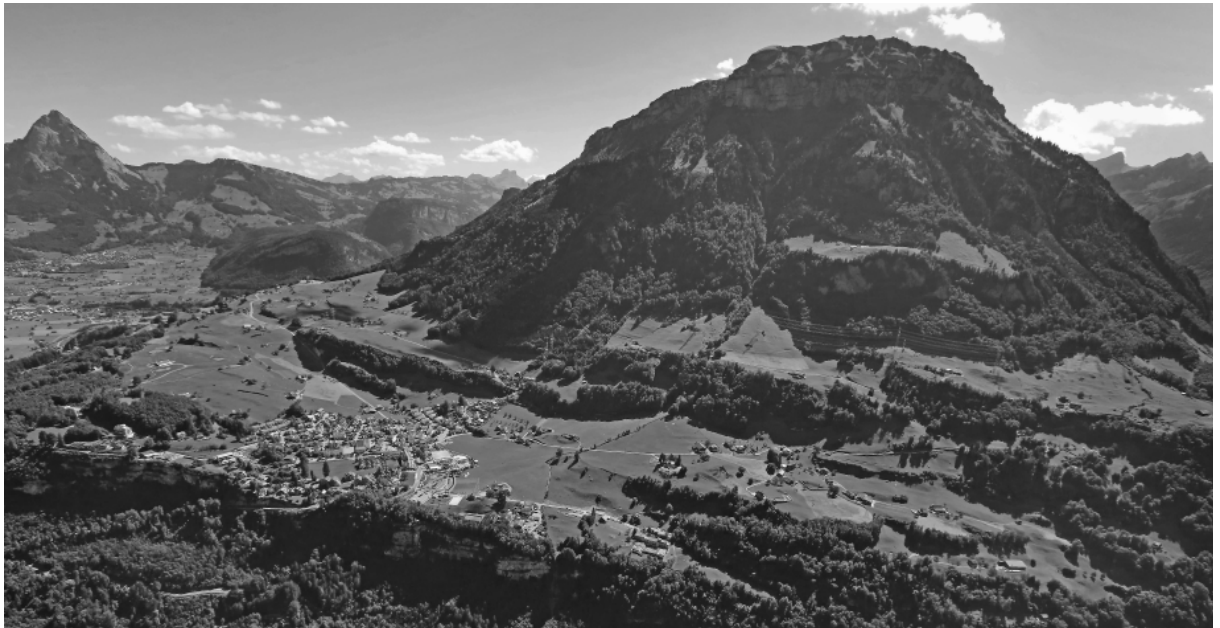
LUFTAUFNAHME VON MORSCHACH

Seit dem eigentlichen Start mit dem Projekt „Dorfentwicklung“ Ende Sommer 2015 konnten bereits diverse wegweisende Abklärungen gemacht werden. Mitte September 2015 tagte ein erstes Mal die Begleitgruppe und konnte dem Gemeinderat wichtige Hinweise auf den Weg geben. Nun ist für den Mittwoch 27. Januar 2016 eine Orientierungsversammlung für die Bevölkerung geplant.