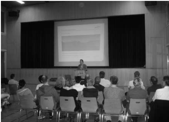
BEGRÜSSUNG DER NEUZUZÜGER/INNEN DURCH DEN GEMEINDEPRÄSIDENTEN

Wie in vielen anderen Gemeinden findet auch in der Gemeinde Morschach eine rege Fluktuation statt. So konnten in den letzten zwei Jahren, nebst nahezu ebenso vielen Wegzügen, rund 150 Neuzuzüge registriert werden.