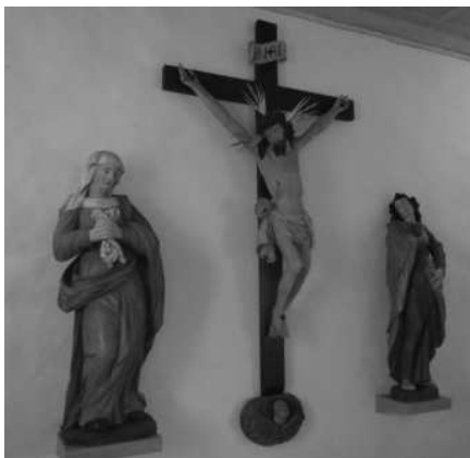
DIE BEMERKENSWERTE KREUZIGUNGSGRUPPE STAMMT VON 1720. URSPRÜNGLICH WAR SIE AM CHORBOGEN DER PFARRKIRCHE MONTIERT.

Die polychrom gefasste hölzerne Kreuzigungsgruppe wurde 1720 geschnitzt. Die Kreuzkonsole ist als Wolke mit geflügeltem Puttenkopf ausgebildet. Maria hält ein zerknülltes Tuch mit vier Quasten in ihren zum Gebet gefalteten Händen. Die Figurengruppe war ursprünglich am Chorbogen der Pfarrkirche montiert gewesen. 1827/28 wurde sie von Marzell Müller jun. neu gefasst und anschliessend in einer offenen Rundbogennische aufgestellt, die der Nordwestecke des Beinhauses vorgelagert war. Seit der jüngsten Gesamtrestaurierung ist sie an der inneren Westwand befestigt.