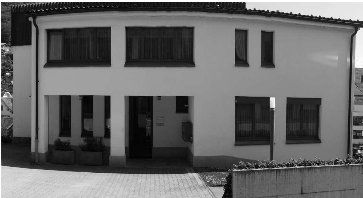
DAS GEMEINDEHAUS AN DER SCHULSTRASSE 6