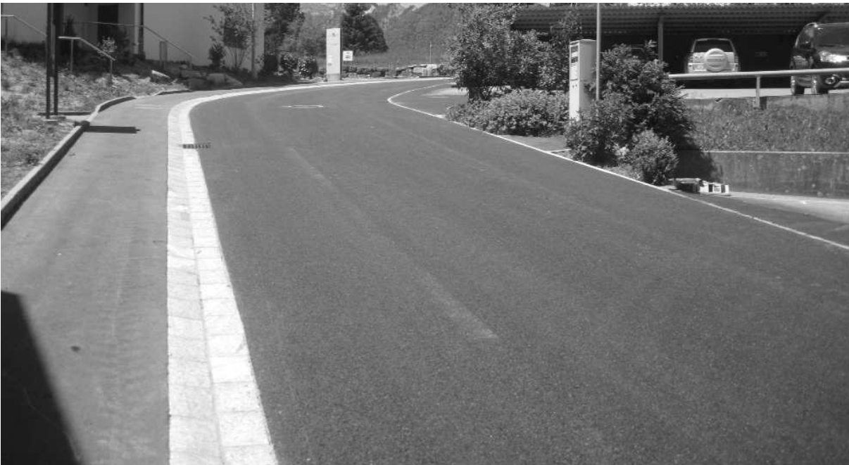
DIE SCHULSTRASSE MIT DEM NEUEN DECKBELAG

Der Neubau der Regenabwasserleitung konnte mit dem Einbau des Deckbelages zeitgerecht abgeschlossen werden. Seit Ende Mai ist das Teilstück der Dorfstrasse (Abschnitt Restaurant Hirschen- Einfahrt Axensteinstrasse) und das Teilstück der Schulstrasse (Restaurant Hirschen – Schulhaus) bereits wieder ohne Einschränkungen befahrbar.