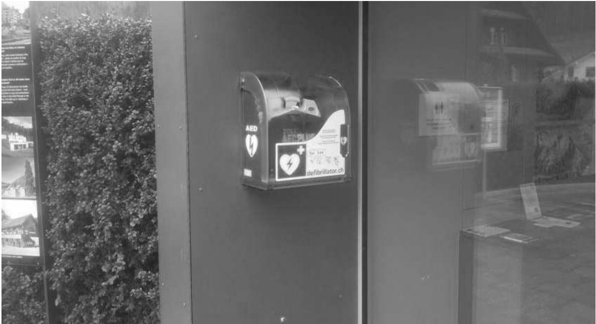
DER NEUE DEFIBRILLATOR STEHT IM NOTFALL BEIM TOURISMUSPLÄTZLI BEREIT

Auf dem Tourismusplätzli beim Eingang des Pavillons wurde im April 2015 ein Defibrillator installiert. Damit wurde die Möglichkeit geschaffen, in einem Notfall umgehend reagieren zu können, um lebensrettende Massnahmen zu ergreifen.