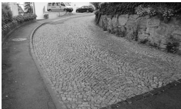
DIE PFLASTERSTEINE AN DER AXENSTEINSTRASSE

Im Abschnitt Postrank bis unterhalb alte Käserei sind noch Pflastersteine verbaut (ca. 80 m 2 ), welche den heutigen Anforderungen nicht mehr entsprechen.