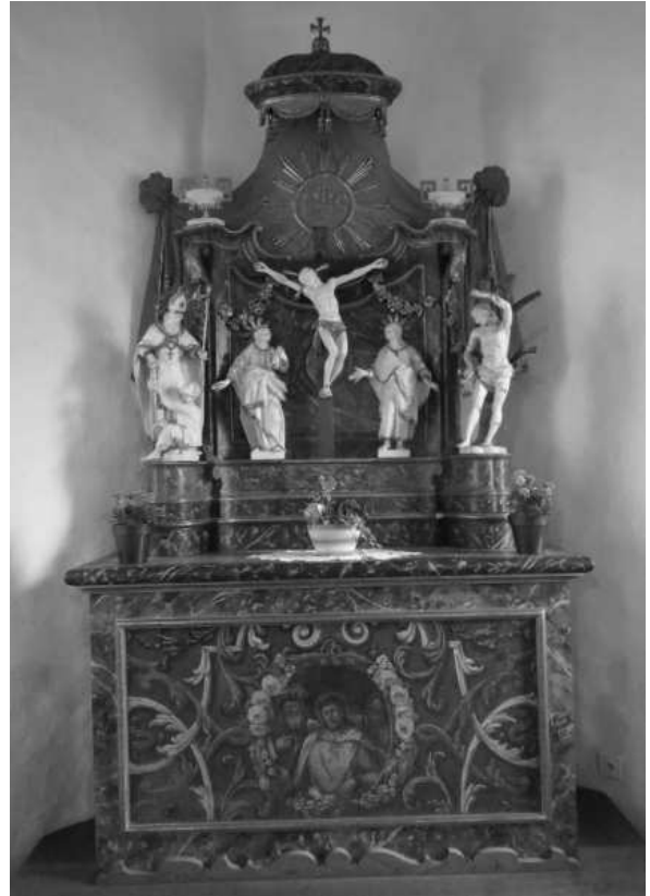
DAS LOUIS-XVI-RETABEL STAMMT AUS DER PFARRKIRCHE UND DÜRFTE VOM GLEICHEN MEISTER STAMMEN WIE DIE 1785 DATIERTE KIRCHENKANZEL.

Das kleine Louis-XVI-Retabel aus der Zeit um 1785 ist der ehemalige Kreuz-Altar im Vorchor der Kirche. 1828 wurde er aus der Kirche entfernt und anstelle des bisherigen, schlecht erhaltenen Choraltars im Beinhaus aufgestellt. Das Holzretabel in Form eines Baldachins mit Lambrequins und seitlichen Vasen ist mit einer gräulichen Marmorimitationsmalerei überzogen. In der zentralen Nische unter dem Jesusmonogramm steht eine hölzerne, weiss gefasste Kreuzigungsgruppe. Die flankierenden Statuen stellen die hll. Martin und Sebastian dar. Das gemalte Leinwand-Antependium lässt sich stilistisch in das zweite Viertel des 18. Jahrhunderts datieren. Verschieden farbige Ranken, die in der Art eines Bandelwerks komponiert sind, umspielen ein Medaillon mit einer Rahmung aus Blütengirlanden. Im Zentrum ist die Verspottung Christi dargestellt.