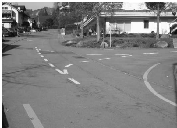
KREUZUNG AXENSTEINSTRASSE / HUSMATT

Bei den Kreuzungen mit weissen Linien hat immer der Verkehrsteilnehmer, welcher von rechts kommt, Vortritt. Als Beispiel sehen Sie die Kreuzungen an der Axensteinstrasse / Husmatt