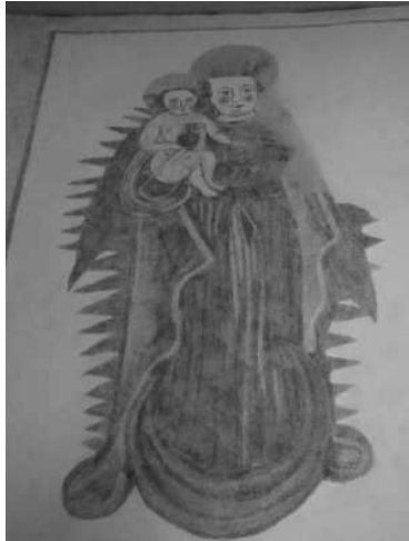
WANDMALEREI AN DER SÜDLICHEN LANGHAUSWAND. DARSTELLUNG DER MONDSICHELMADONNA ALS FÜRBITTERIN FÜR DIE VERSTORBENEN.

An den Wänden des Langhauses konnten 1986 stellenweise Malereien freigelegt und restauriert werden. Für die nach der Mitte des 17. Jahrhundert anzusetzende Bemalung lassen sich in der Region kaum Vergleichsbeispiele anführen. Sie entstanden vielleicht im Zusammenhang mit der Gründung der Rosenkranzbruderschaft 1655. An der Südwand des Langhauses werden die beiden Fensteröffnungen von einer einfachen Architekturmalerei eingefasst. Die Laibungen sind mit Blumen besetzt, während die Fensterbekrönungen aus je zwei gegenständigen Voluten bestehen, die in Blumensträussen und Fruchtgirlanden enden. Zwischen den Fenstern und gegen die Chorbogenwand sind figürliche Darstellungen zu sehen.