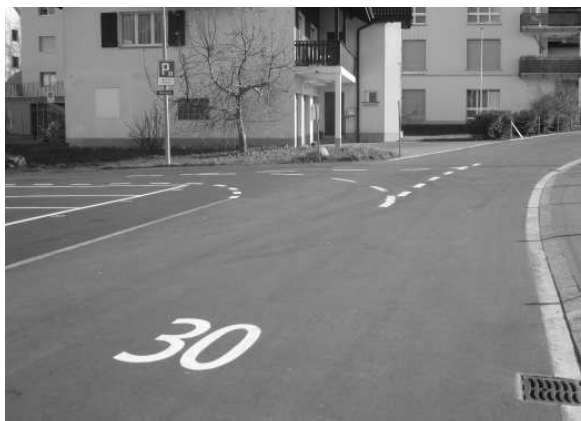
KREUZUNG SCHILTISTRASSE / SILBERGASSE

Bei den Kreuzungen mit weissen Linien hat immer der Verkehrsteilnehmer, welcher von rechts kommt, Vortritt. Als Beispiel sehen Sie die Kreuzungen an der Axensteinstrasse / Husmatt