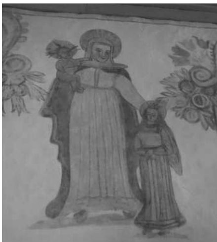
WANDMALEREI AN DER SÜDLICHEN LANGHAUSWAND. DARSTELLUNG DER ANNA SELBDRITT ALS BEWAHRERIN VOR DEM SCHNELLEN TOD.

An den Wänden des Langhauses konnten 1986 stellenweise Malereien freigelegt und restauriert werden. Für die nach der Mitte des 17. Jahrhundert anzusetzende Bemalung lassen sich in der Region kaum Vergleichsbeispiele anführen. Sie entstanden vielleicht im Zusammenhang mit der Gründung der Rosenkranzbruderschaft 1655. An der Südwand des Langhauses werden die beiden Fensteröffnungen von einer einfachen Architekturmalerei eingefasst. Die Laibungen sind mit Blumen besetzt, während die Fensterbekrönungen aus je zwei gegenständigen Voluten bestehen, die in Blumensträussen und Fruchtgirlanden enden. Zwischen den Fenstern und gegen die Chorbogenwand sind figürliche Darstellungen zu sehen.