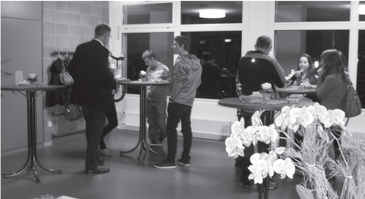
IM FOYER DES SCHULHAUSES GENOSSEN DIE JUNGBÜRGER EINEN KLEINEN APÉRO.