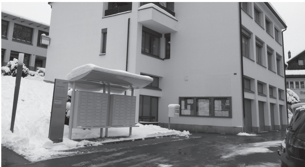
DAS GEMEINDEHAUS UND DIE POSTFACHANLAGE

Die Gemeindeverwaltung sowie die Postagentur Morschach bleiben an den eidgenössischen, kantonalen und kommunalen Feiertagen sowie an folgenden "Brückentagen" geschlossen.