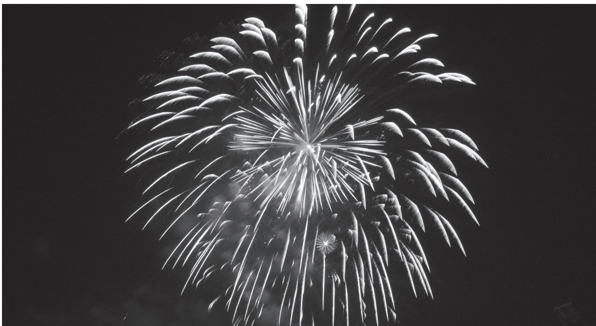
DAS FEUERWERK VOM SWISS HOLIDAY PARK FINDET AM 1. JANUAR 2013 STATT.

Am 1. Januar 2013 lassen wir's krachen und feiern den Jahresbeginn mit einem grandiosen Feuerwerk, das unsere Bisherigen bei weitem übertrifft.