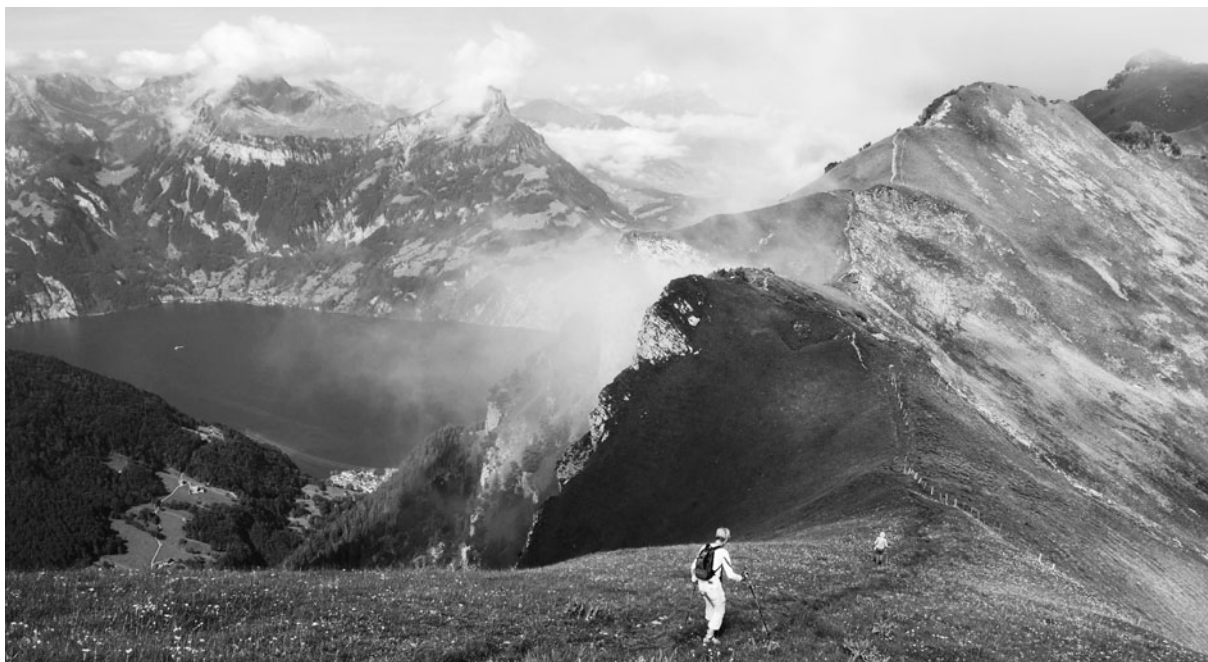
EIN GEMEINSAMER AUFTRITT BIETET NEUE PERSPEKTIVEN.

Die Gemeinde Morschach hat ihren lang ersehnten neuen Auftritt. In Zusammenarbeit mit Morschach-Stoos Tourismus, den Stoosbahnen und «härzhafts us» konnte ein einheitlicher Auftritt erstellt werden.