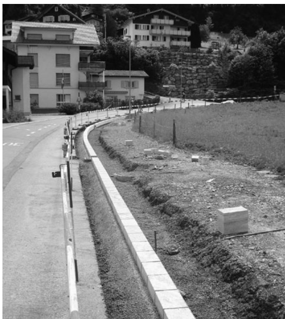
SANIERUNGS- UND AUSBAUARBEITEN.

Die Bauherrschaft und sämtliche am Bau Beteiligten sind bestrebt, die Arbeiten termingerecht und unter grösstmöglicher Rücksichtnahme aller Betroffenen durchzuführen. Die Gemeinde Morschach dankt allen Verkehrsteilnehmern und Anstössern für ihr Verständnis.