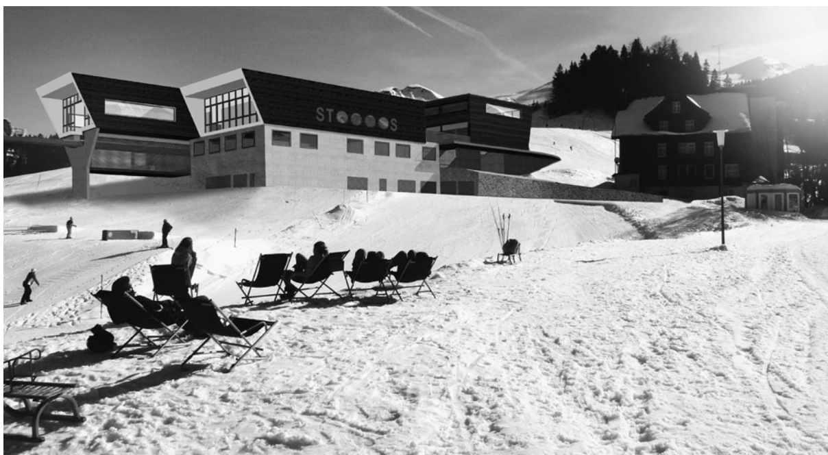
ENTWURF NEUE BERGSTATION.

Mit Dankbarkeit und Freude durfte das sehr gute Resultat der Bezirksabstimmung vom 11. März 2012 entgegen genommen werden. Dies, nachdem die Gemeinde Morschach bereits im vergangenen Herbst mit einem hohen Ja Anteil der Umzonung wie auch dem Investitionsbeitrag von 5 Mio zugestimmt hatte.